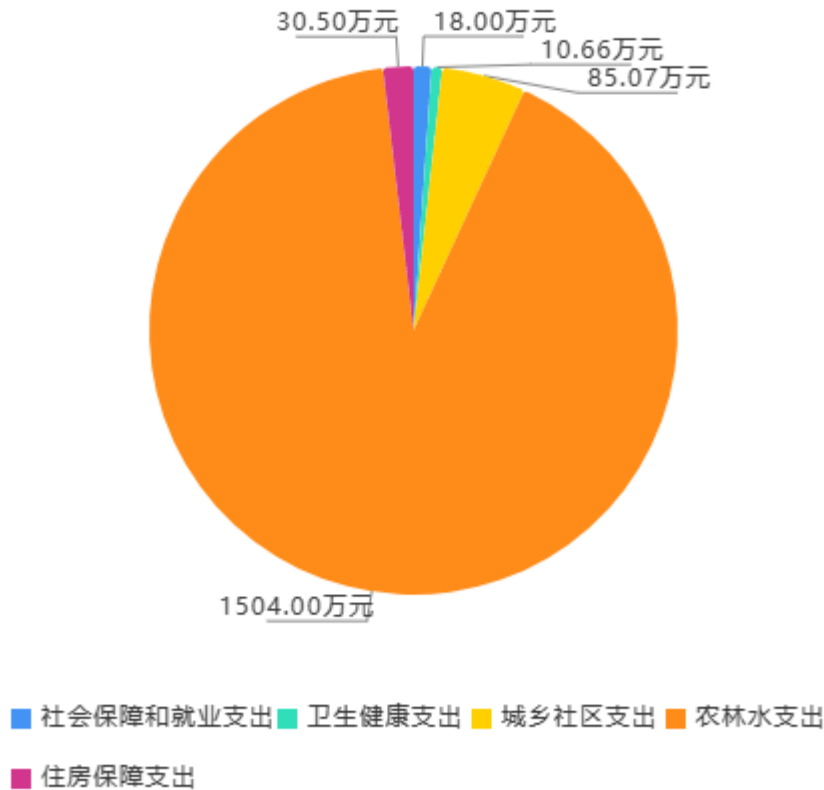
2024年财政拨款预算支出构成

社会保障和就业（类）支出18.00万元，占1.09%；卫生健康（类）支出10.66万元，占0.65%；城乡社区（类）支出85.07万元，占5.16%；农林水（类）支出1,504.00万元，占91.25%；住房保障（类）支出30.50万元，占1.85%。