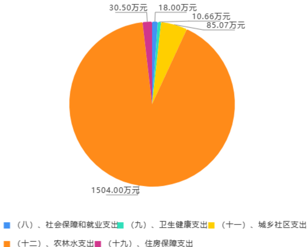
2024年财政拨款预算支出

支出85.07万元，农林水支出1,504.00万元，住房保障支出30.50万元。